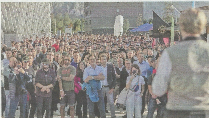
Das Interesse bei der Eröffnung war groß.